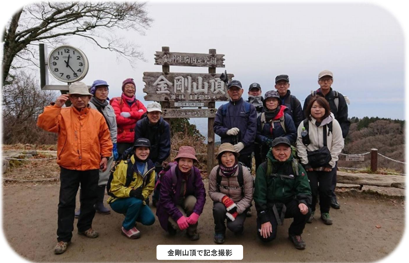
金剛山頂で記念撮影

14:30 雨がパラパラし出した二河原辺集会所で解散。 …お疲れ様でした。 記: 山本正史