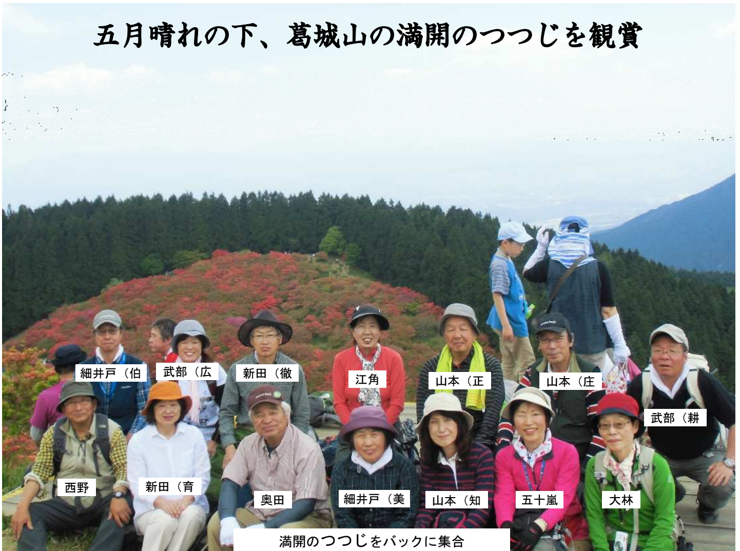
満開のつつじをバックに集合