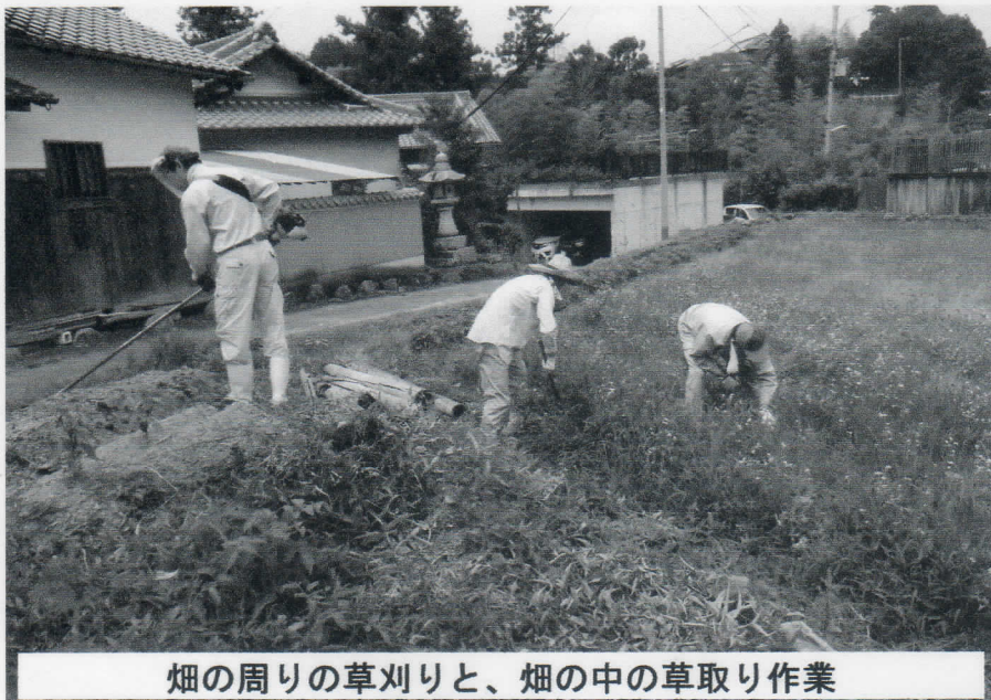
畑の周りの草刈りと、畑の中の草取り作業