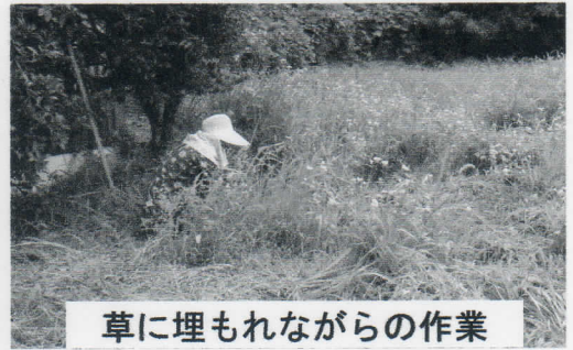
草に埋もれながらの作業

3月・4月に種蒔きした「そば畑」も5月下旬から花が咲き始め、畑一面が真っ白になっています。そばと共に、草も畑一面に茂っていったので、周囲の草刈りと畑の中の草取りを行いました。そばの実も入っていますので、収穫が楽しみです。