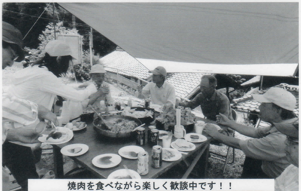
焼肉を食べながら楽しく歓談中です！！