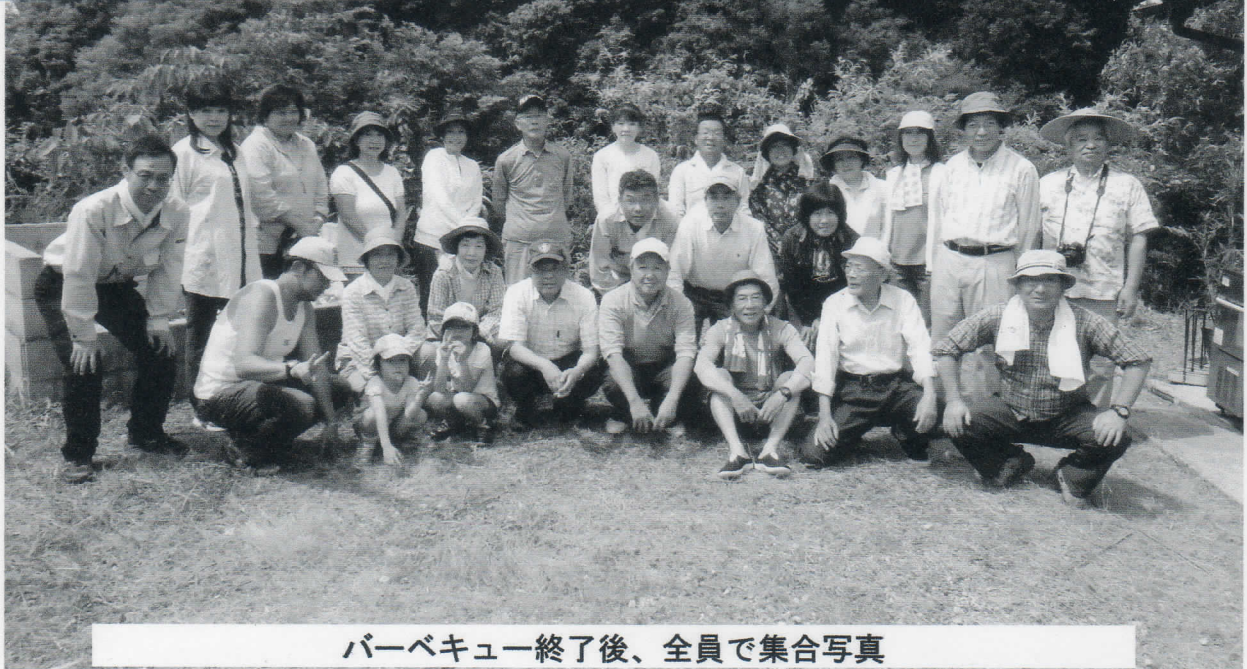
バーベキュー終了後、全員で集合写真