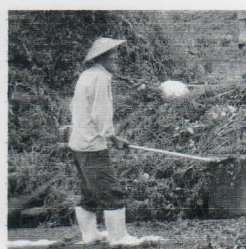
在りし日の桂さん