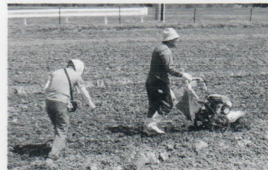
初めての耕運機に悪戦苦闘！！