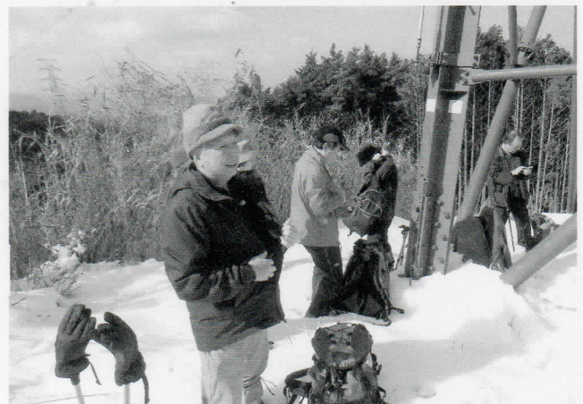
途中の鉄塔下でひと休みです