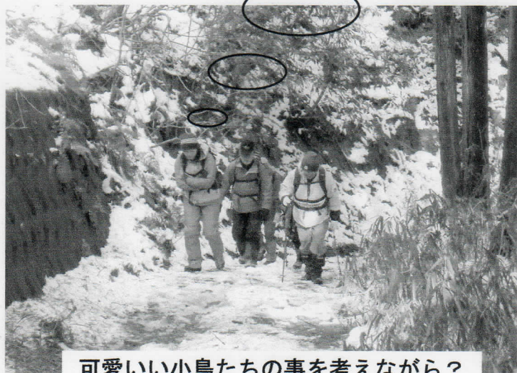
可愛い小鳥たちの事を考えながら？