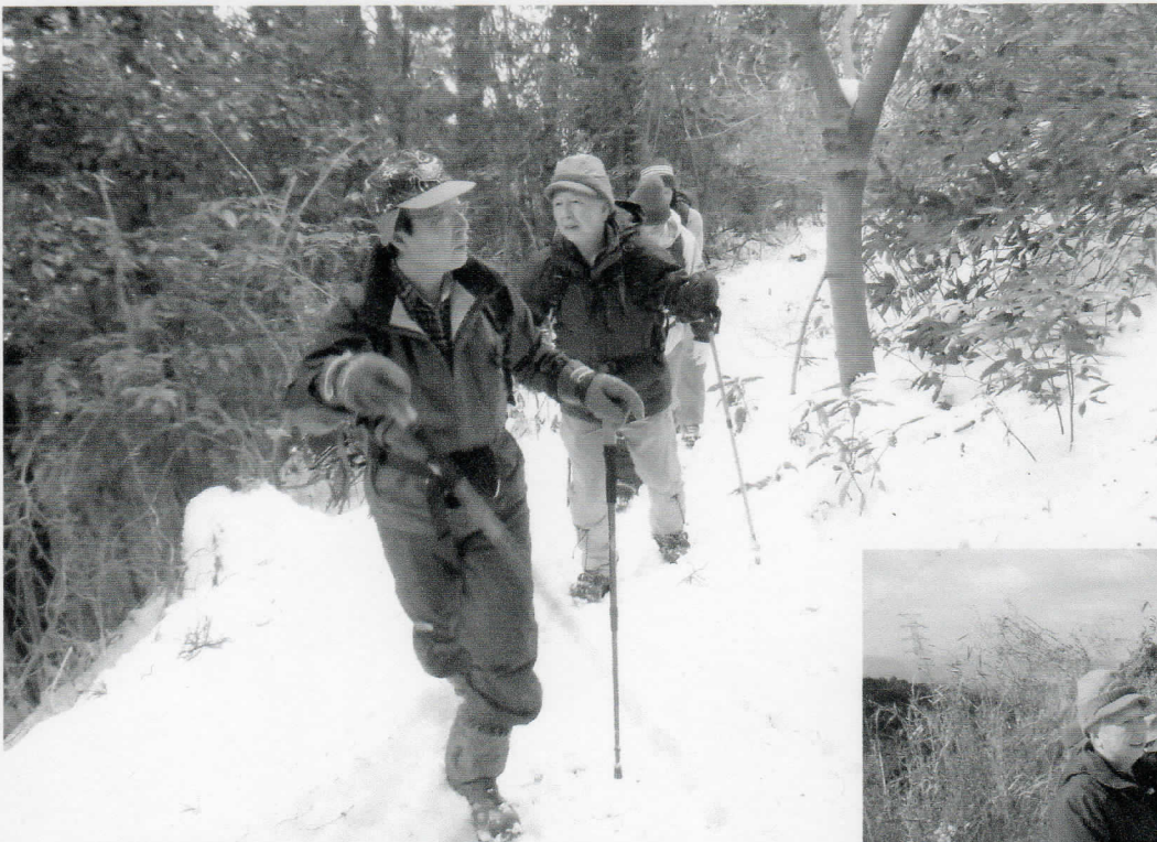
深い雪を踏みしめ、鳥を探しながら・・・

記録的な大雪の為、当初予定していた「奥河内 金剛山登山&バードウォッチング」のコース(ロープウェイ前バス停前集合～)での登山が難しくなったため、コースを二河原邊・水分道に変更して実施しました。途中、シジュウガラや数種の鳥の声を聞くことは出来ましたが、残念ながら、小鳥たちの姿をはっきりと見ることは出来ませんでした。また、今回はアクシデント発生の為、コースを再変更して青崩道を経由して下山しました。