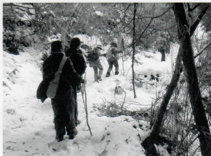
二河原邊集会所から二河原邊小屋に向かう途中、大きなイノシシが横たわっていました。