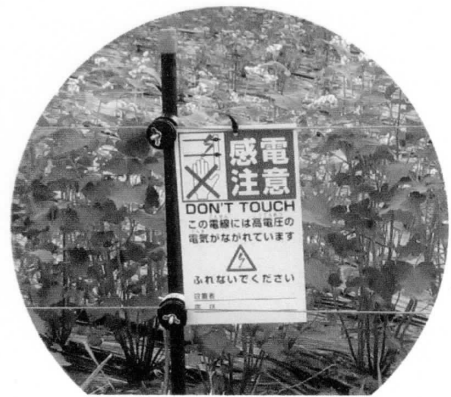
「感電注意」の表示を設置