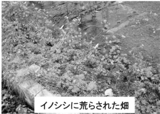
イノシシに荒らされた畑