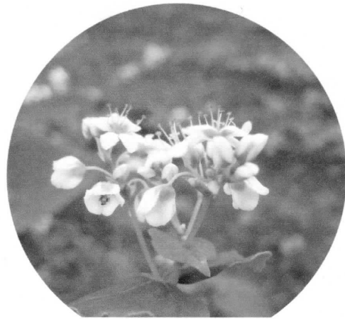
綺麗に、可愛く咲いたそばの花