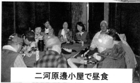
二河原邊小屋で昼食