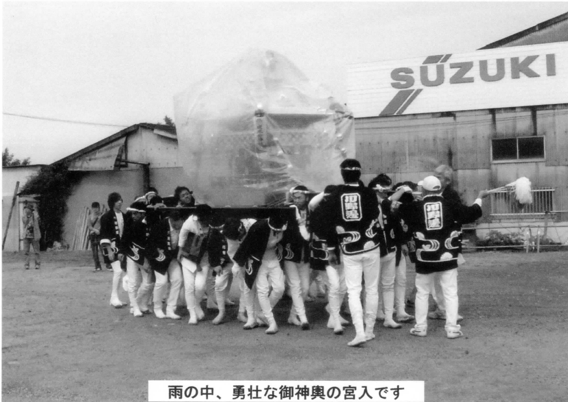
雨の中、勇壮な御神輿の宮入です

E-Mail:kongomt.chihaya.akasaka.club@gmail.com