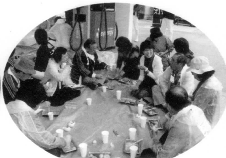
地元のみなさんとの交流