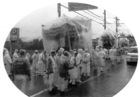
雨の中のだんじり曳行