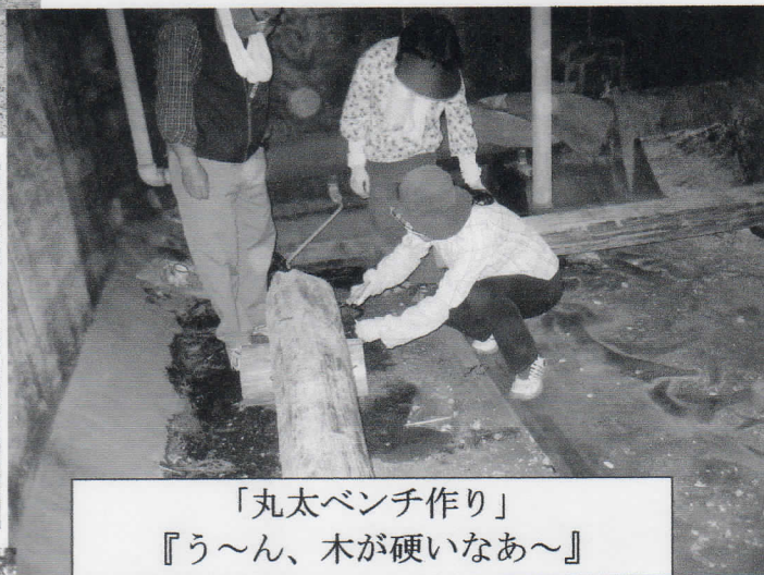
「丸太ベンチ作り」 『う～ん、木が硬いなあ～』

畝は作って頂いていたので、表面の土を平らに均す作業から開始。道具が重い！でも気持ちのいい汗です。種まきの要領を教わり、さあ、種まき！軽くて薄い種が無事に芽を出してくれるのか、楽しみが増えました。