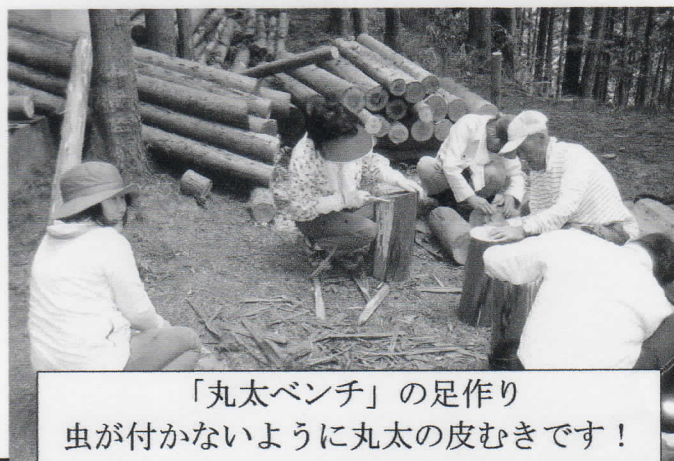
「丸太ベンチ」の足作り 虫が付かないように丸太の皮むきです！