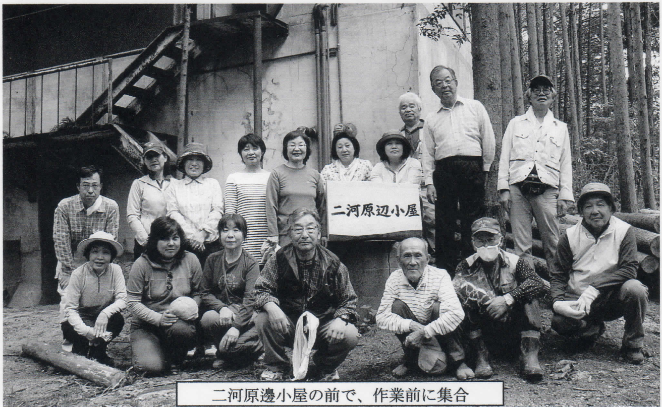
二河原邊小屋の前で、作業前に集合