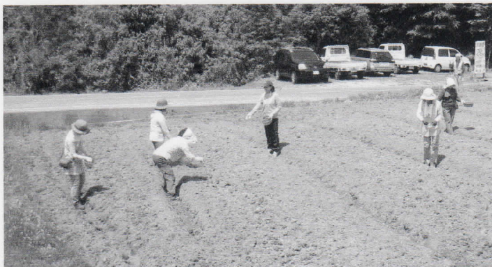
みんなで「そば」の種まき 『早く綺麗な花を見たいな～!!』

午後からは二河原邊小屋の清掃とベンチ作り、そして看板の設置。看板を吊るす支柱、ベンチの足になる木を切り、男性達がきれいに木の皮をはぎます。女性も負けていませんよ。