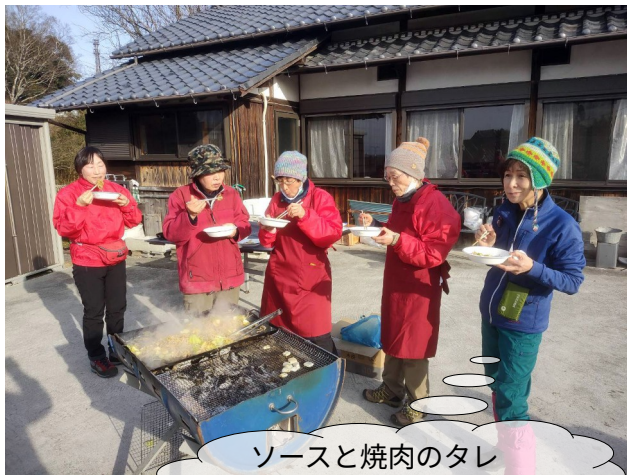
ソースと焼肉のタレ が合ってるわあ